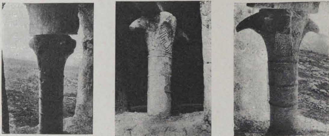
Fig. 212. — Capitells d'Olèrdola

Amb ocasió de restaurar la petita església i son arc de ferradura, hom tractà d'obrir un finestral tapiat en l'església romànica, i allí aparegué una columna que sostenia les dues arcades de la finestra bessona amb el capitell que anem ràpidament a descriure (fig. 212).